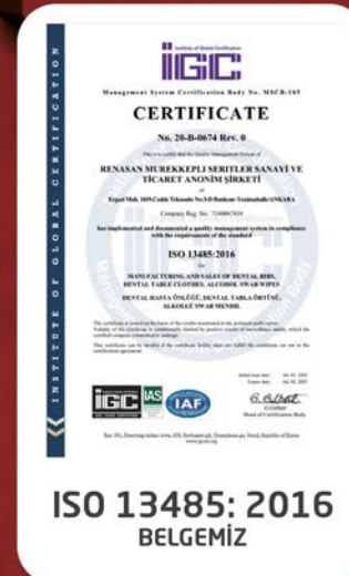
ISO 13485:2016 BELGEMİZ