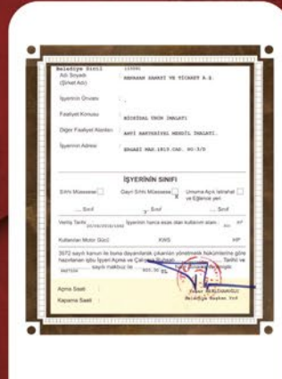
BİYOSİDAL ÜRÜN ÜRETME İZİNİMİZ