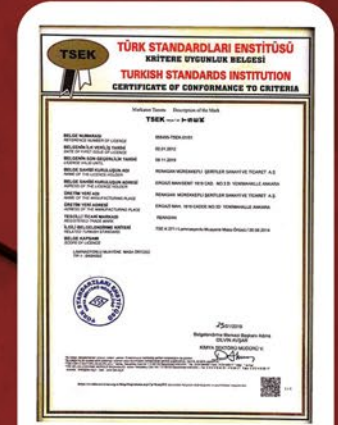
TSEK 271 BELGEMİZ