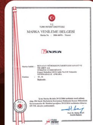
MARKA YENİLEME BELGEMİZ