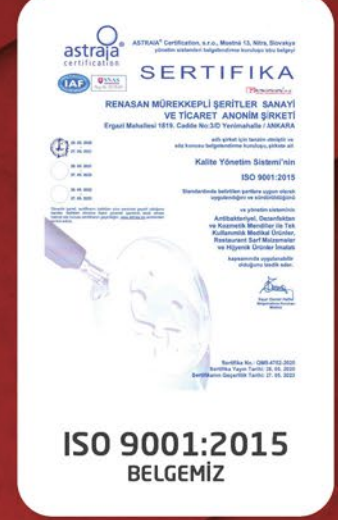
ISO 9001:2015 BELGEMİZ