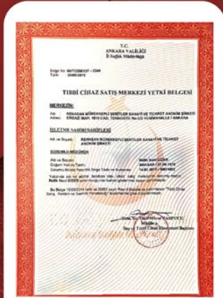
TIBBİ CİHAZ SATIŞ MERKEZİ YETKİ BELGEMİZ